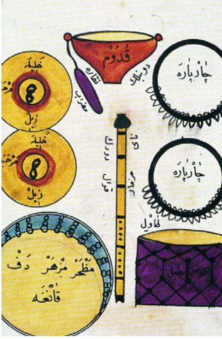
Celvetîler'in musiki aletleri ( Derviş Çehizi , s. 226)

Mahmûd Hüdâyî'nin etkisiyle gerçekleşmiş olmalıdır. 12