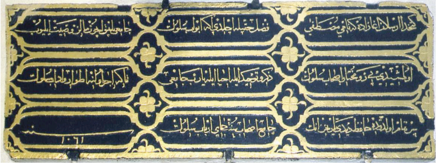
Şeyh Mustafa Devatî Efendi Camii Kitabesi

gönülden gitmesinin, kalbin parlak bir ayna hâline gelmesinin ve sûfinin safâyâ erişmesinin hep Allah'ı zikretmek ile mümkün olabileceğini belirtmiştir (26/1-6). Onun çok sevdiği zikir çeşitlerinin başında “kelime-i tevhîd zikri” gelmektedir. Mehmed Tâlib Efendi, kelime-i tevhîd zikrine özel bir önem vermiş ve “Lâ ilâhe illallah” (1/1), “Tevhîde gel tevhîde” (4/1), “Gel gönül tevhîd edelim” (7/1) vb. nakarat mısralı birçok ilâhî yazmıştır. Şâirimiz, “Lâ ilâhe illallah” nakarat mısralı yedi kıt'alık ilâhîsinde ise bu kez, kelime-i tevhîdin çeşitli özelliklerine yer vermiştir. Bunlar arasında dört kitabın manasının onda bulunması, cümle dertlerin devası olması, kulu yola getirmesi, ölmüş kalbi diriltmesi ve nihâyet hakikate erdirmesi yer almaktadır: