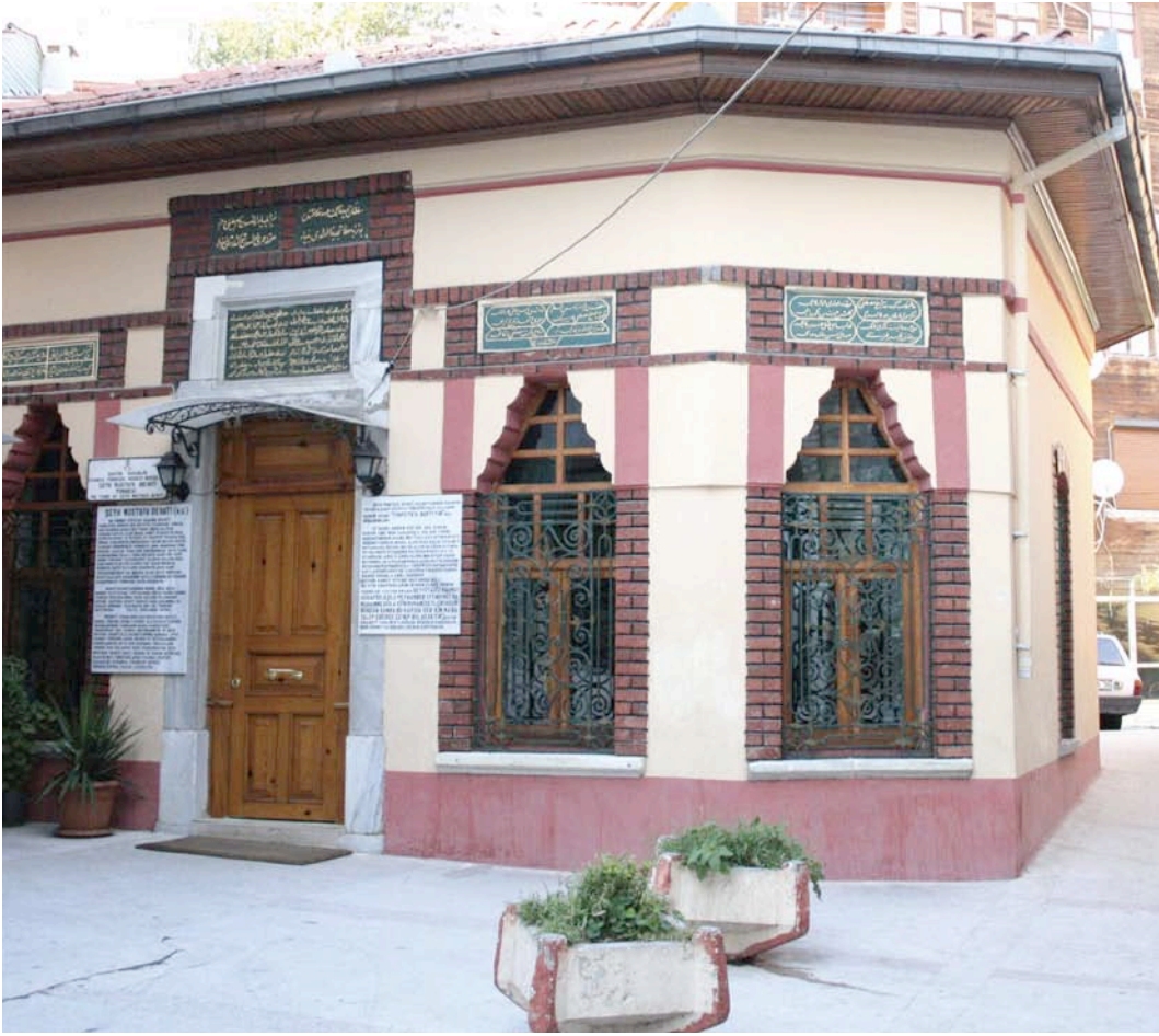
Mehmed Talip Efendi'nin babası Mustafa Devatî ile birlikte medfun olduğu türbe

Şiirlerine bir bütün olarak bakıldığında seyr ü sülûkunun çeşitli safhalarını görmek de mümkün olabilmektedir. Bazı şiirlerinde henüz yolun başında olduğunu (9, 11, 14, 36) ve neler yapması gerektiğini dile getiren şâir (2, 4, 8, 31, 52), bazı şiirlerinde yavaş yavaş yola girdiğini ve dervişliğin tadını aldığını belirtir (38, 59, 60). Yine bazı şiirlerinde ulaştığı mertebelerin coşku ve heyecanını yaşamaya başladığını bildiren şâirimiz (10, 46), bazı şiirlerinde ise vuslata erdiğini; dolayısıyla sevincinden ne yapacağını şaşırılmış ve nasıl şükredeceğini bilemez bir hâlde olduğunu dile getirir (37, 55, 63, 64, 74, 85).